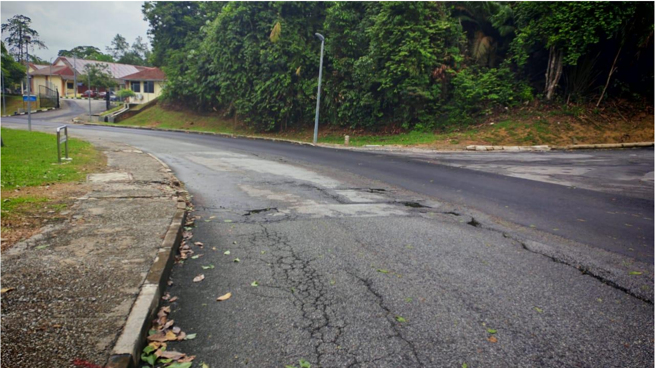
Gambar 5 : Keadaan jalan berlubang perlu ditampal ( regulate ) dengan premix yang dibekalkan sebelum kerja turapan premix dilaksanakan