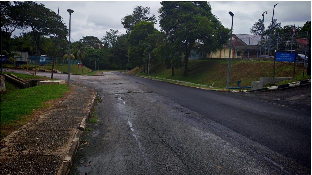
Gambar 6 : Keadaan jalan berlubang perlu ditampal ( regulate ) dengan premix yang dibekalkan sebelum kerja turapan premix dilaksanakan