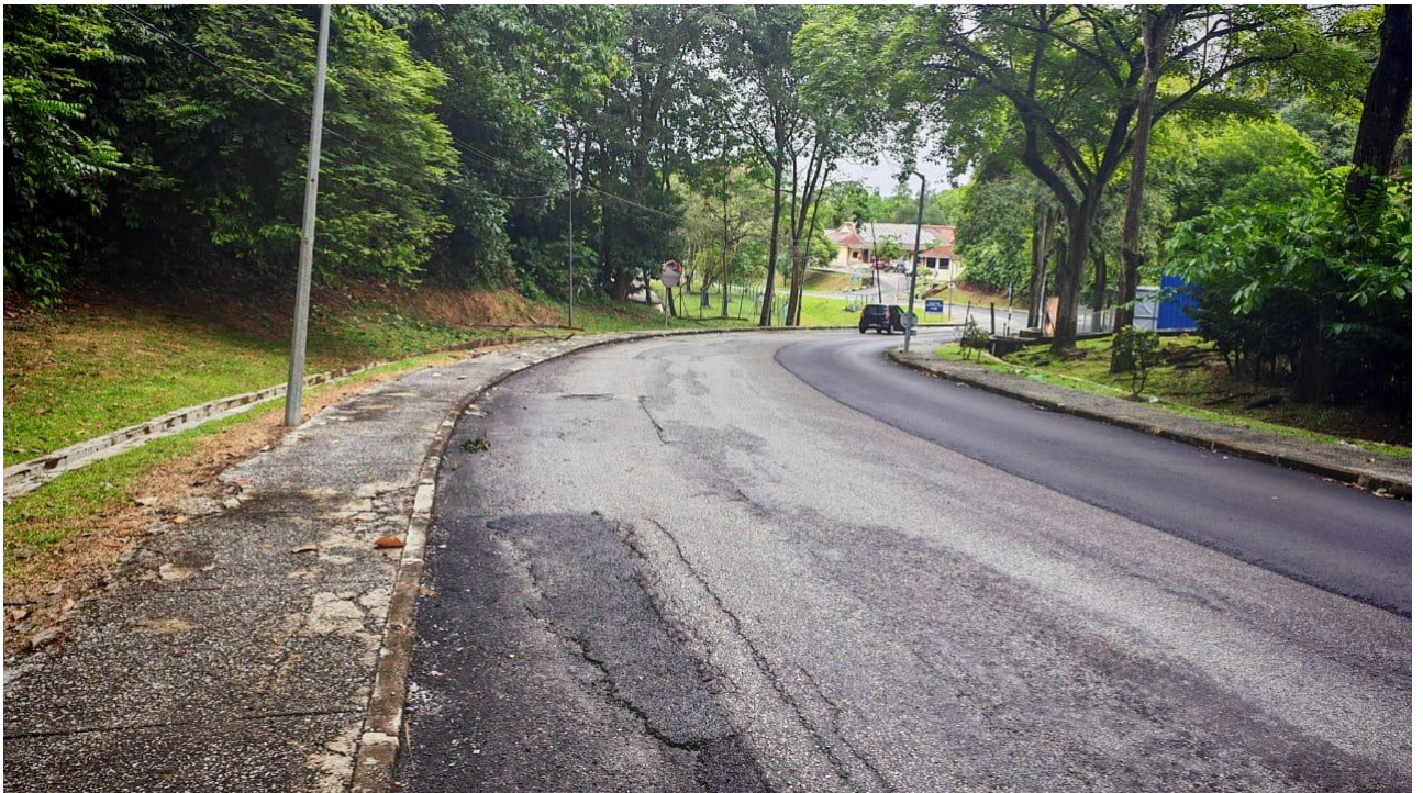
Gambar 4 : Keadaan jalan di sekitar tapak