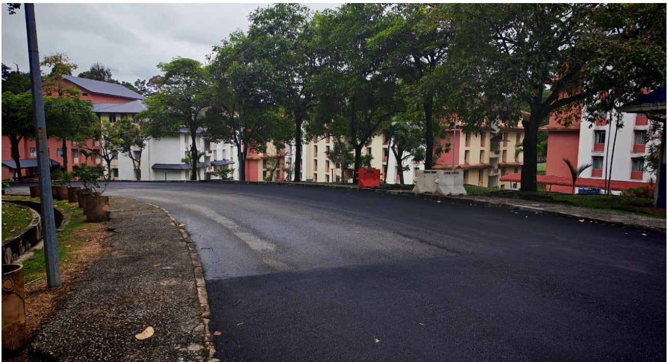
Gambar 2 : Keadaan jalan di sekitar tapak