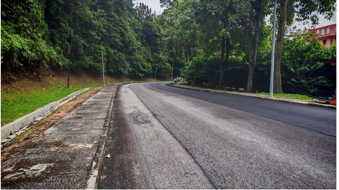
Gambar 3 : Keadaan jalan di sekitar tapak